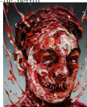
Deshecho Óleo sobre lienzo

(/artistas/feria/2-edicion-en-malaga/1-scheroff-miguel/221-descarnado)