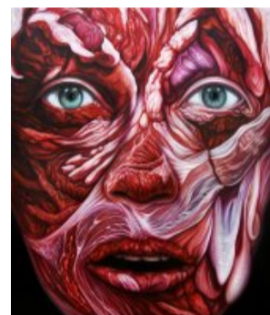
Flesh Vanitas VII Óleo sobre lino

(/artistas/feria/2-edicion-en-malaga/1-scheroff-miguel/219-cabeza-de-perro)