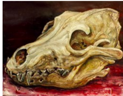
Cabeza de perro Óleo sobre papel

(/artistas/feria/2-edicion-en-malaga/1-scheroff-miguel/218-cabeza-de-vaca-deshollada)