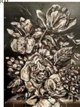
Jarrón barroco Óleo sobre papel

(/artistas/feria/2-edicion-en-malaga/1-scheroff-miguel/224-