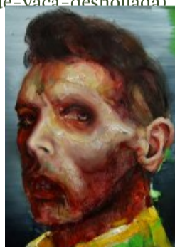
Descarnado Óleo sobre papel

(/artistas/feria/2-edicion-en-malaga/1-scheroff-miguel/220-flesh-vanitas-vii)