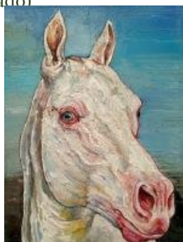
Caballo blanco Óleo sobre papel

(/artistas/feria/2-edicion-en-malaga/1-scheroff-miguel/223-rude-boy)