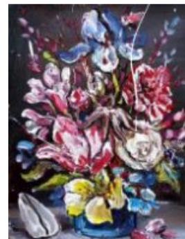
Jarrón barroco II Óleo sobre papel

(/artistas/feria/2-edicion-en-malaga/1-scheroff-miguel/225-