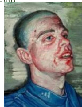
Rude boy Óleo sobre papel

(/artistas/feria/2-edicion-en-malaga/1-scheroff-miguel/222-deshecho)